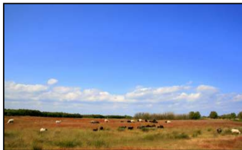
Naturpleje på Øvre

Den første infotavle er placeret på Havnen, og er en introduktion til ruten. På infotavlerne er der en QR kode, som fører dig ind på Endelave Lægeurtehaves hjemmeside, hvor du kan læse mere om nogle af de emner, der beskrives på tavlerne. NaTour de Endelave er selvfølgelig ikke forbeholdt cyklister, men kan også vandre.