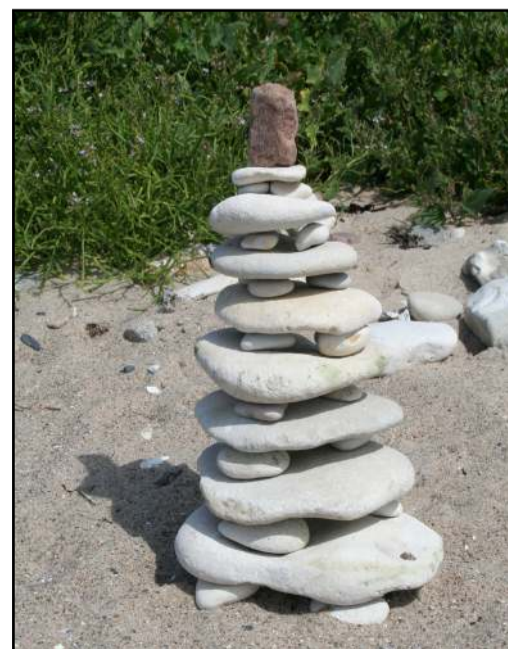
Der er inspiration til at lege med sten via QR koderne på infotavlerne.

Cykelrutens infotavler er forsynet med QR koder for børn, hvor du kommer ind på en side med opgaver, lege, aktiviteter og andet sjov, der er koblet til netop det sted hvor du scanner koden. Medbring gerne papir, blyant og tuschpen på turen. Efter turen kan du også finde opgaverne derhjemme på websiden www.endelave-laegeurtehave.dk