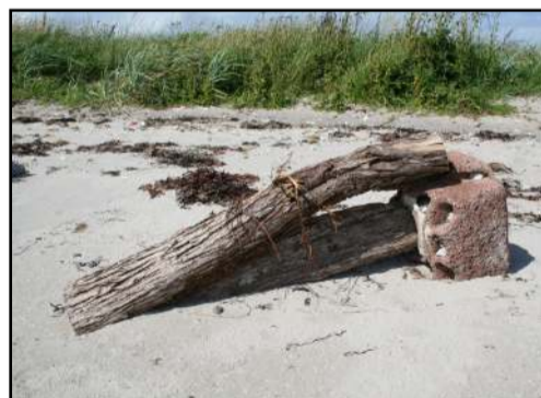
Strandkunst ved klinten

Ruten fortsætter mod Klinten, og nogle steder er stien god nok til at cykle på, andre steder må cyklen trækkes. Ved Klinten er infotavle nr. 10 placeret, og her drejer du til højre op ad græsstien. Ruten går tværs over Naturlejrpladsen og P-pladsen og kommer ud til Vesterby, som er en asfalteret vej, og her findes endnu en infotavle.