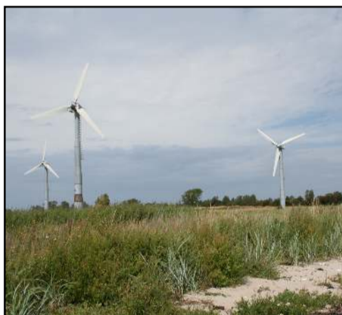
Møllerne ved Søndermølle

Madpakkehuset ligger på en lille plads ved hjørnet af Havhornet, Lynger og Kongevejen. Her er der offentligt toilet ved Fiske- og Røghuset, og ved selve madpakkehuset er der vandpost, hvor du kan fylde drikkedunken. Her er det helt oplagt at nyde madpakken, især hvis vejret er vådt. Her finder du også infotavle nr. 6 på selve pladsen ved Madpakkehuset. Hvis man vil undgå strækninger, hvor der skal trækkes på stranden, kan man afslutte turen her og cykle tilbage til byen ad Kongevejen.