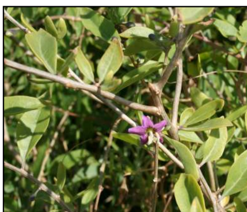
Bukketorn er almindelig på Endelave

Vejen fortsætter langs levende hegn med Rynket Rose og Bukketorn, og ved naturreservatet Flasken er øens fugletårn placeret. Her kan du bl.a. læse om reservatet på infotavle nr. 3. Videre ad Strandvejen kommer man forbi genbrugspladsen, som nok er en af Danmarks smukkeste placerede genbrugspladser.