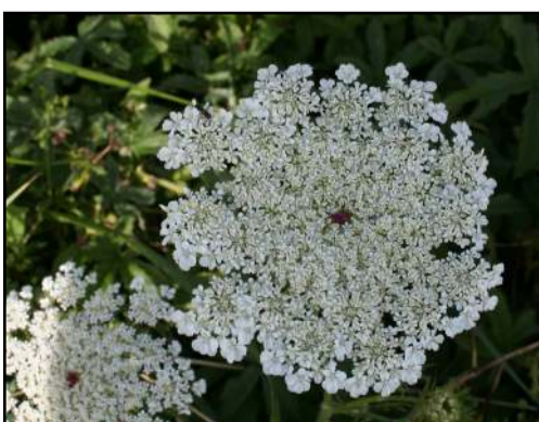
Vild Gulerod ved Sønderhavet. Den røde blomst midt i skærmen har til formål at tiltrække insekter til bestøvning.

Ellers fortsætter ruten til venstre ad Lynger, og på Gøgeurtvej møder du infotavle nr. 7. Så går turen gennem sommerhusområdet og ude ved vandet er endnu en tavle placeret. Her skal du nu til højre ad græsstien, som på det første stykke er god at cykle på. Inden møllerne kommer en strækning, hvor stien ikke er god at cykle på, og her må trækkes.